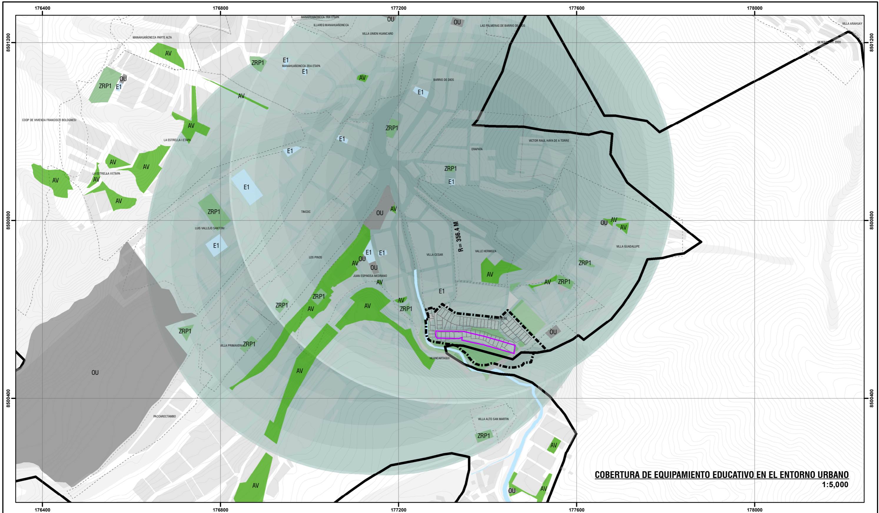
COBERTURA DE EQUIPAMIENTO EDUCATIVO EN EL ENTORNO URBANO 1:5,000